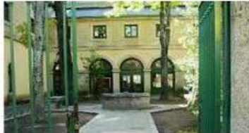
La Casa de Cultura acoge el sábado un concierto para guitarra y voz